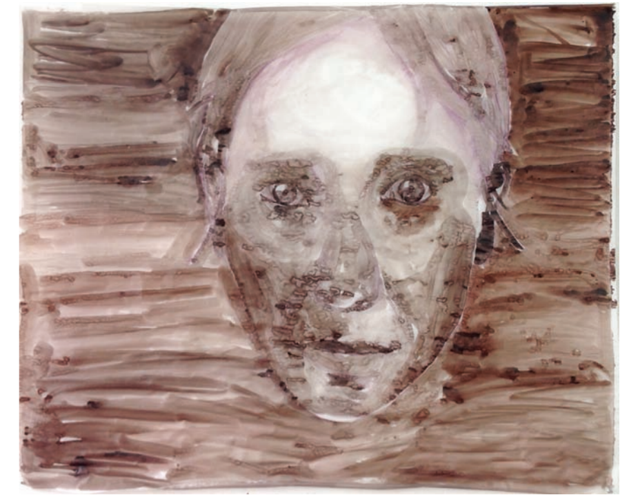
Zondert Titel, 2017, bister op calqueerpapier, 110 x 120 cm

Margreet Bouman (1953) www.margreetbouman.nl