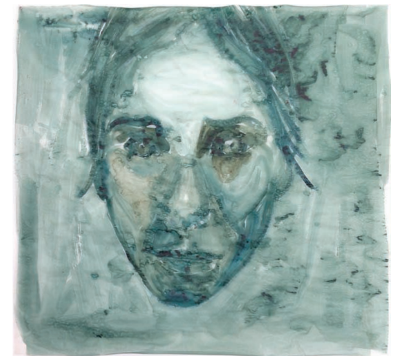
Zondert Titel, 2017, bister op calqueerpapier, 105 x 110 cm

Met mijn portretten heb ik als het ware een alter ego gecreëerd, dat zichzelf continue spiegelt aan de buitenwereld. Achter de diepere lagen van het IK gaat een veelheid aan psychologische-, levensbeschouwelijke- en filosofische metaforen schuil.