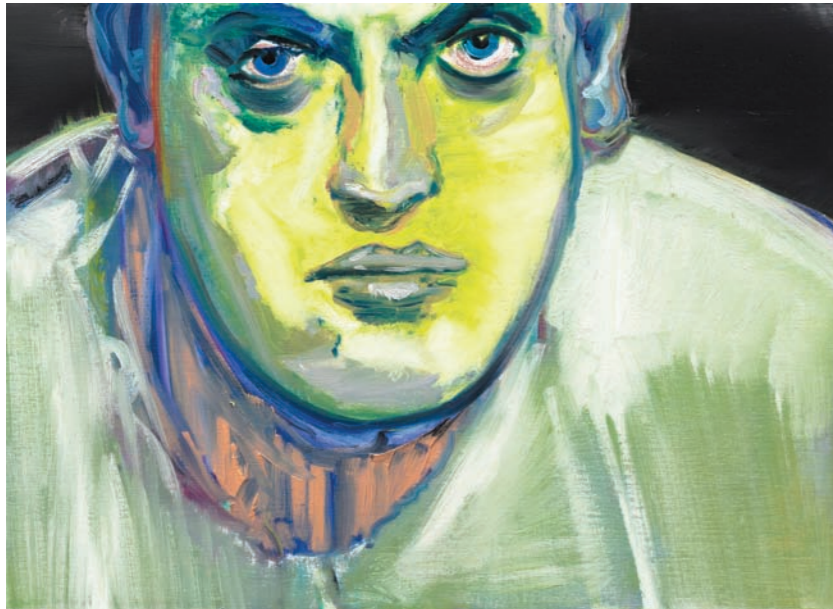
Old School (Young Buñuel), 2008, olieverf op linnen, 55 x 75 cm

Michiel Hogenboom (1967) www.michielhogenboom.com