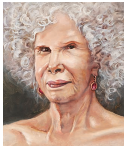
Hertogin van Alva, 2015, olieverf op paneel, 48 x 41 cm