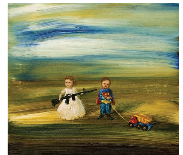
Met geweer en speelgoedauto, 2017 olieverf op linnen, 24 x 25 cm.