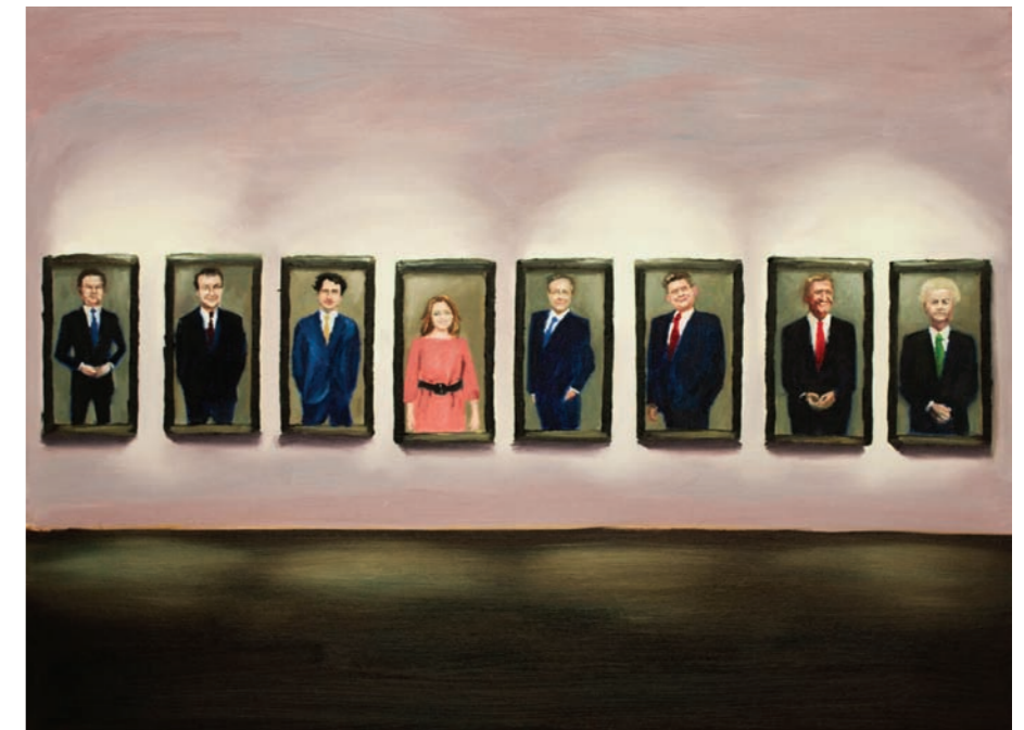
Galerij van lijsttrekkers, 2017, olieverf op linnen, 70 x 95 cm.

"Met geweer en speelgoedauto" is een werk uit mijn meest recente serie schilderijen. Deze zijn ontstaan vanuit mijn gevoel over actualiteit en huidige ontwikkelingen in de wereld.