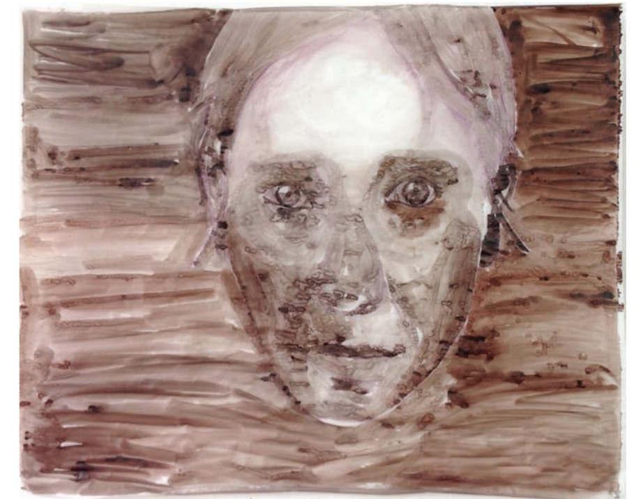
Zondert Titel, 2017, bister op calqueerpapier, 110 x 120 cm