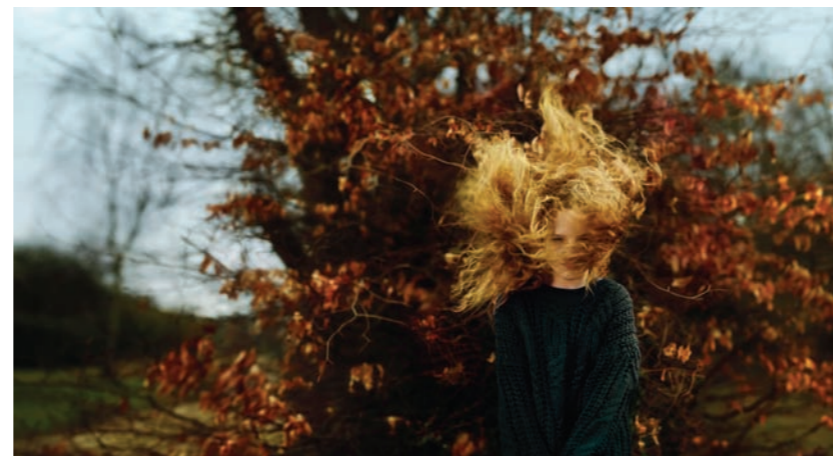
Haarlem – Wies, 65 x 120 cm.

De foto's van landschappen van Ellen Kooi zijn teatraal, verhalend en vaak mysterieus van aard. Er lijkt zich meer af te spelen dan datgene wat men, op het eerste gezicht, ziet. Het landschap en de associaties die een locatie oproept zijn meestal haar uitgangspunt.