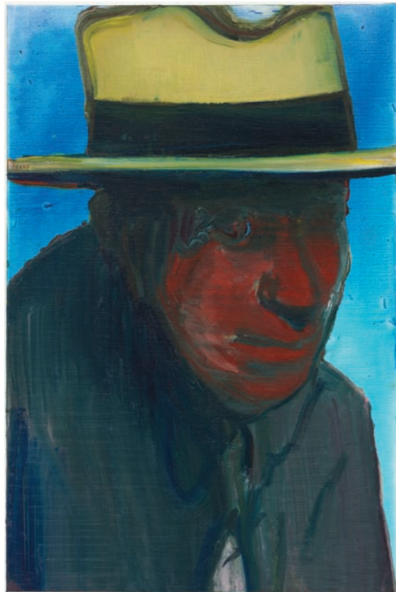
Ocean, 2009, olieverf op linnen, 75 x 50 cm

Sommige kunstenaarsportretten zijn onweerstaanbaar en daardoor actueel. Het is de mengeling van eerzucht en iets onbestemds, ongrijpbaars die je dwingt je tot hen te verhouden.