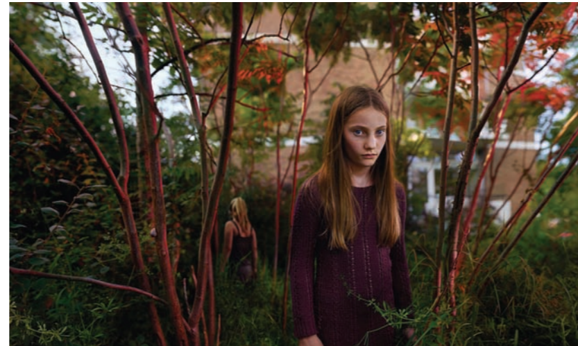
Zandvoort – Noah, 70 x 117 cm.