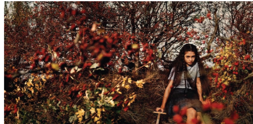
Noordwijk - Bessen